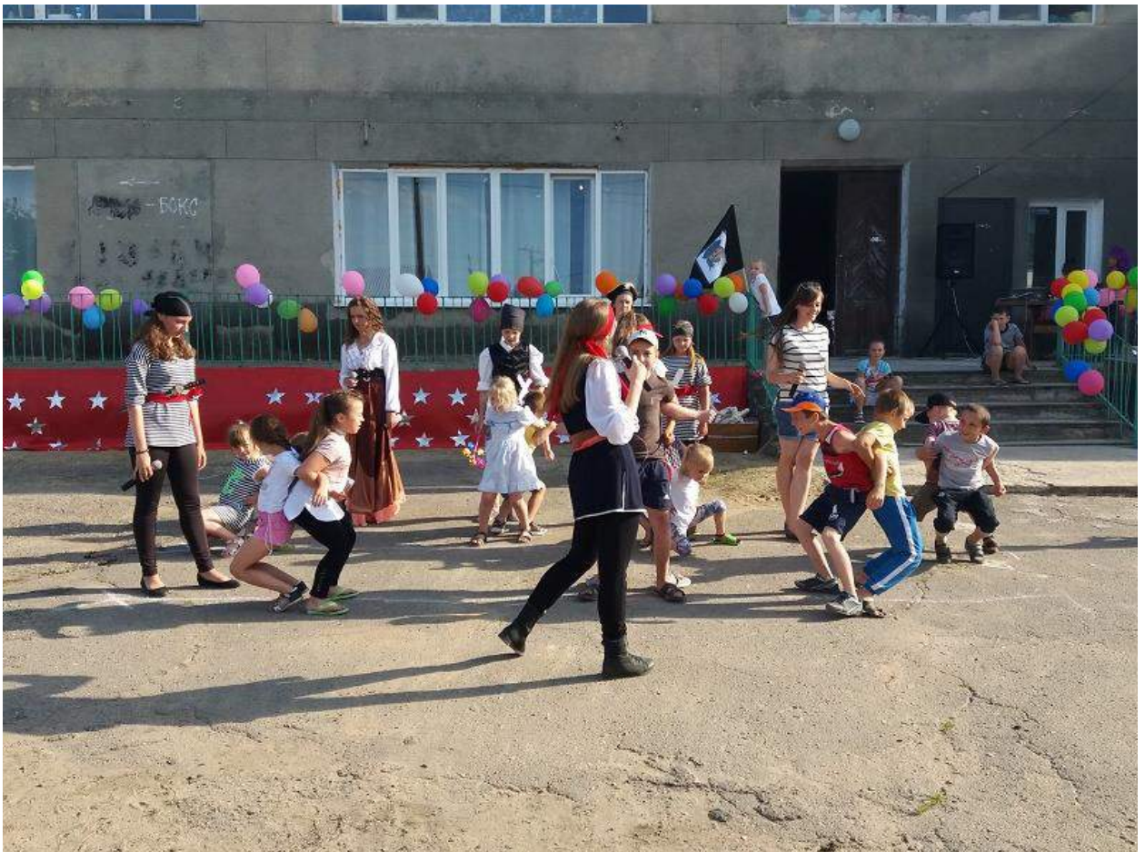
Святковий концерт, присвячений Дню Незалежності України: