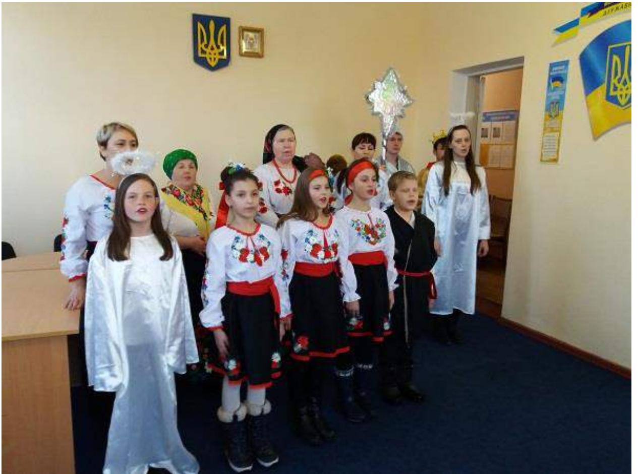
Конкурс «Місіс Кучурган 2017»: