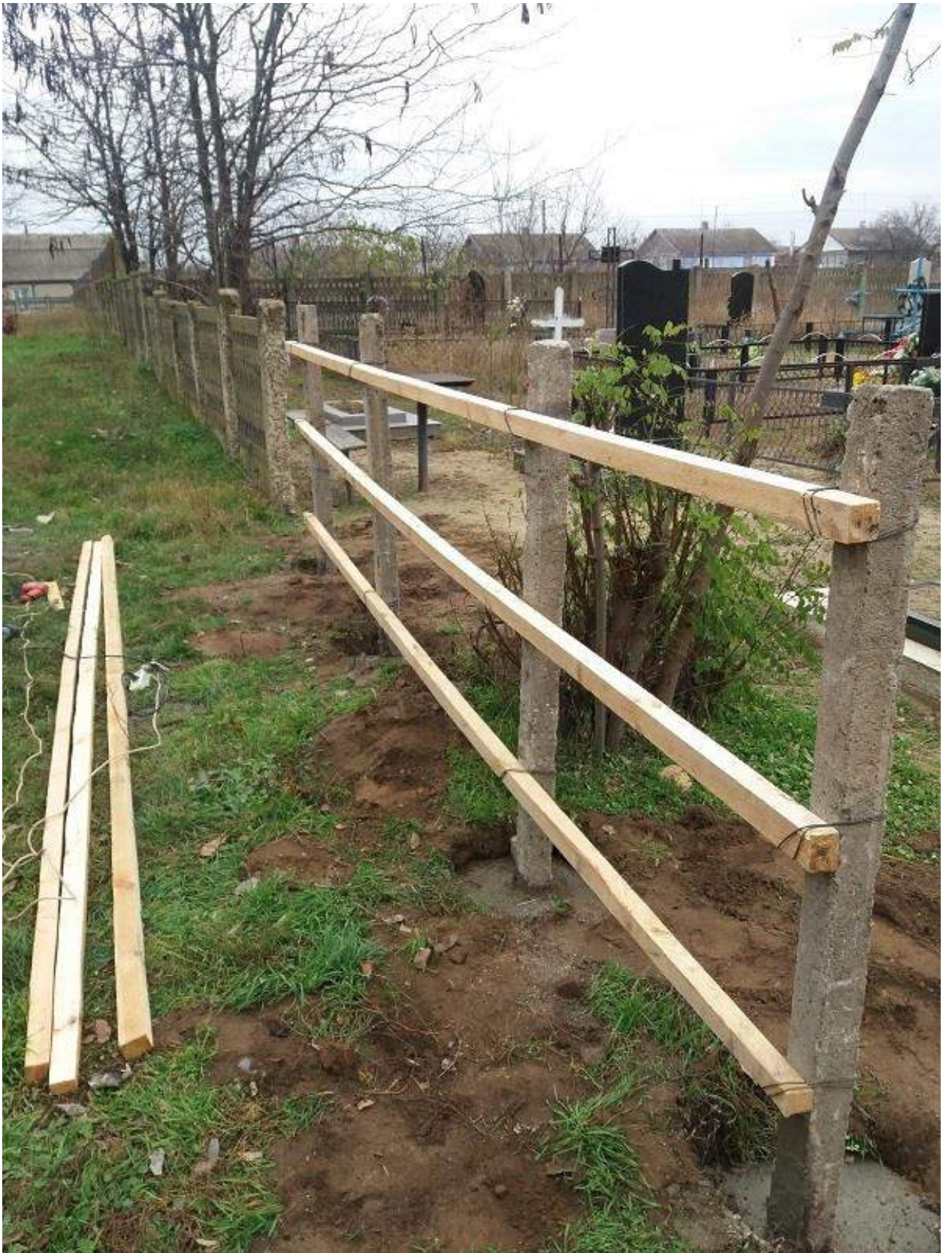
Облаштування вуличного дитячого ігрового майданчика на території Кучурганської ЗОШ І-ІІІ ст. ім. П.М. Каплуна на який було витрачено - 36 547,00 грн.