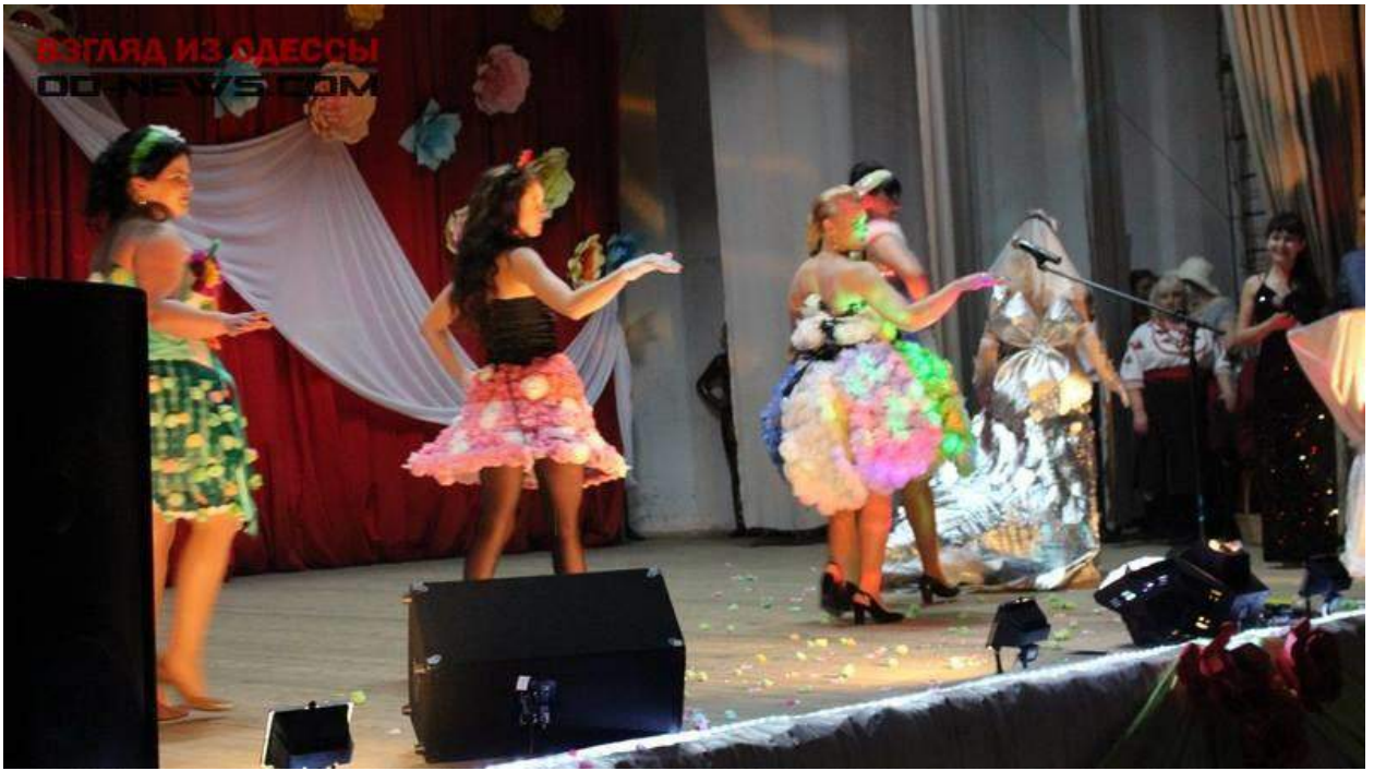
Розважальна програма, присвячена Дню захисту дітей: